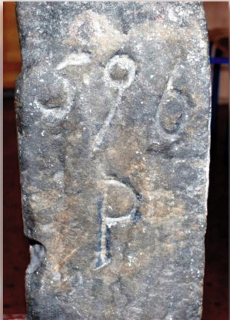
Ilustracja 1: Kamień graniczny zakonu cystersów z lubawskiej szkoły przy ul. Mickiewicza. Znak pozbawiony jest większości części podziemnej, która być może została w przeszłości utracona; prawdopodobnie z tego powodu zamontowany został na wykonanej wtórnie podstawie (odlewie betonowym?), która pozwala na jego ekspozycję w ustawieniu pionowym. Z prawej strony widoczny numer „596” oraz litera „P”. Fotografie: Paweł Kasprzyk, październik 2008 roku.